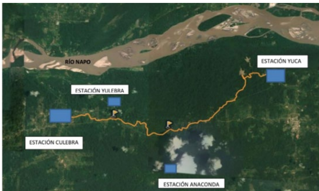
Figura 1. Trayectoria de la tubería de transferencia Yuca Culebra (16 Km de longitud).

El Campo Auca es un área petrolera de la Provincia de Orellana, Ecuador, que se encuentra en el Bloque 61 de la Amazonia Ecuatoriana, es uno de los Campos Petroleros más productivos de EP Petroecuador. El Activo Auca está integrado por los Campos Cononaco, Rumiyacu, Tortuga, Chonta, Auca Sur, Auca Central, Culebra, Yulebra, Anaconda, Pitalala, según el reporte diario de producción del 1 de enero del 2025, el campo Auca produjo 73,001,81 BPPD (Barriles de petróleo por día).